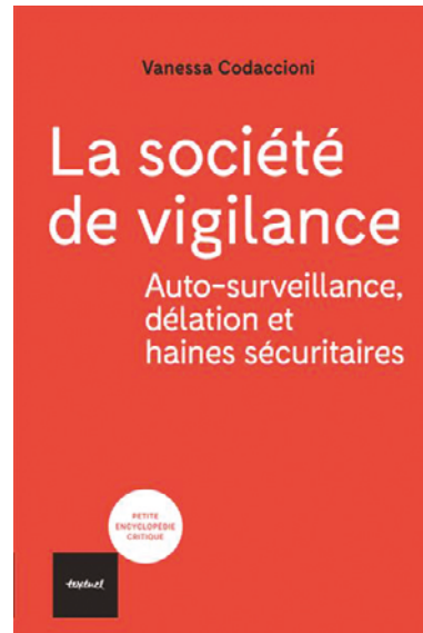
La société de vigilance, Vanessa Codaccioni Textuel 2020 – 156 p

Cette « société de vigilance », on peut en dater les prémises avec les attentats du 11 septembre 2001 qui ont constitué une rupture en la matière avec depuis un double mouvement, accéléré par la mise en œuvre de technologies en plein développement : surveillance constante, massive et systématique de la population avec la pratique généralisée du traçage et du fichage sur un plan vertical, mais également « sous-veillance », c'est à dire surveillance horizontale par laquelle chacune et chacun surveille autrui et est surveillé. Tous surveillants, tous surveillés. « Il s'agit de produire une insécurisation mutuelle qui s'auto-alimente et renforce le contrôle des populations par l'État. ». Nous sommes tous potentiellement dangereux, maintenus ainsi dans un état général d'insécurité permanente par une sorte d'auto-surveillance. Nous légitimons par la même la répression qui nous isole les uns des autres au détriment de luttes de solidarité qui devraient nous rassembler.